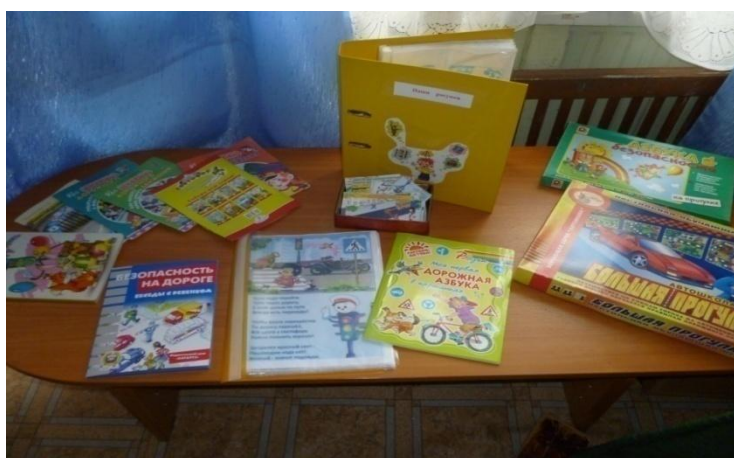
Виды транспорта, дорожные знаки

Литература, настольно-печатные игры, наглядные пособия.